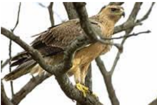
ÁGUIA DE BONELLI

No Sul de Portugal há também uma pequena população de águias-douradas e populações florescentes de falcões-peregrinos, de grifos e de outras espécies ameaçadas como o milhafre-real, o francelho-das-torres e os falcões-abelheiros.